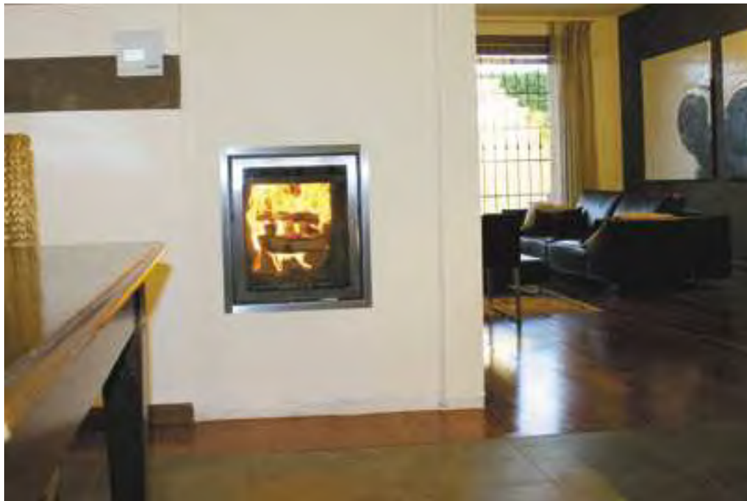
Una moderna stufa a olle è in grado di coprire l'intero fabbisogno termico di una CasaClima.

Fumisti: Stufe a olle in CasaClima e risanamenti. A che cosa devono stare attenti progettisti e costruttori?